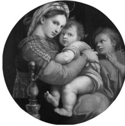
Rafael Sanzio. La Virgen de la Silla . 1514.