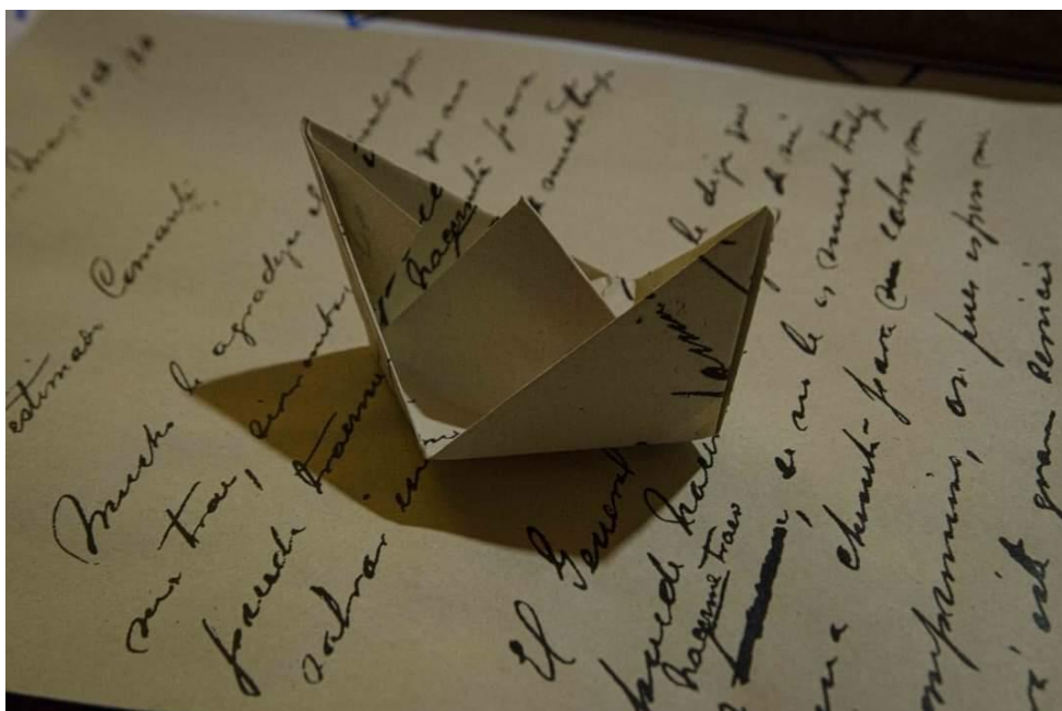
Figura 1. Barco hecho con copias de las cartas.

barcos y canoas que flotaban en el arroyo que da nombre y vida a Valcheta 4 . Por último, estas piezas fueron prendidas fuego, por lo cual iluminaron la noche. Asimismo, en la performance se estableció un diálogo con un paisaje sonoro que desarmó la linealidad de las cartas a partir de la repetición de nombres, ciudades, fechas y de un extraño pericón que operaba como telón de fondo de esta enumeración.