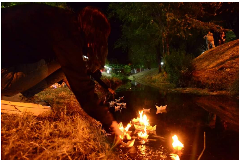
Figura 3. Puesta a navegar de barcos encendidos en el arroyo Valcheta.

Centro de Estudios y Actualización en Pensamiento Político, Decolonialidad e Interculturalidad Universidad Nacional del Comahue ISSN 1853-4457 Nro. 14, 2023