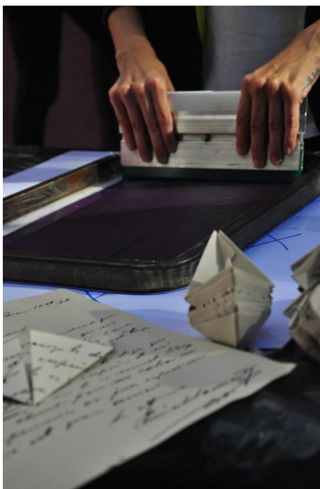
Figura 2 Creación de cartas, en el Museo provincial María Inés Koop de Valcheta.

Centro de Estudios y Actualización en Pensamiento Político, Decolonialidad e Interculturalidad Universidad Nacional del Comahue ISSN 1853-4457 Nro. 14, 2023