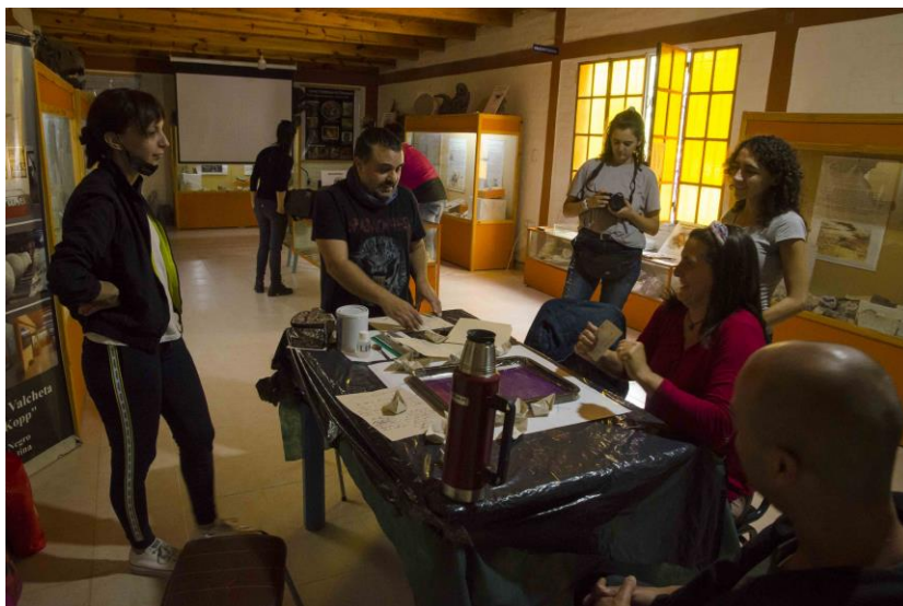
Figura 5. Trabajo y conversación sobre la obra, dentro del Museo Provincial Inés Koop, de Valcheta.

Afirmamos que las cartas (la correspondencia), volvieron a nacer como Nocorrespondencia , en tanto la obra en territorio rompió la relación de complementariedad entre traficantes de infancias, de un punto al otro de la estrategia genocida. En esta línea recuperamos en parte reflexiones como las de Laura Catelli (2018), quien concibe a los archivos (o museos) no como lugares donde se construye el pasado, sino donde se disputa el presente; y para quien lo colonial no es una suerte de contenido perteneciente a un archivo, sino una posición en el presente. Posición que el agua, en su detenerse, nos mostró.